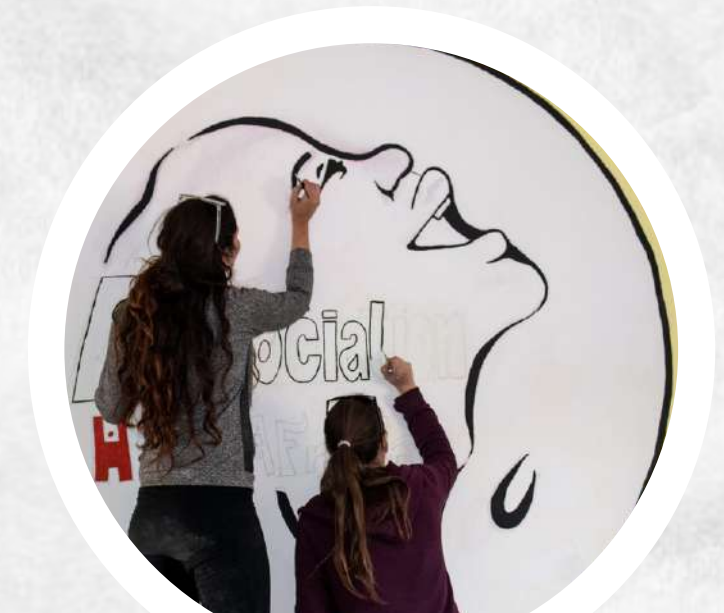
Decoración y mantenimiento