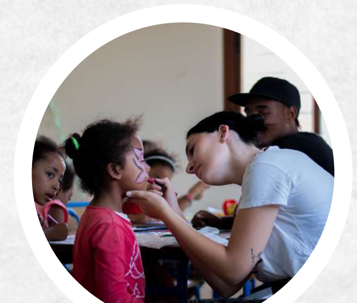
Talleres de manualidades