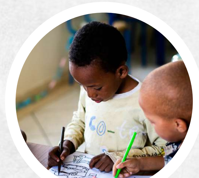
Talleres de idiomas