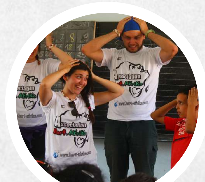
Talleres de ocio